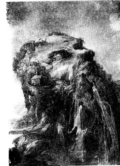
Przemiana. Jossé de Momper. Zima. Kunsthistorisches Museum w Wiedniu

w labiryncie aż do jego środka (który jest obrazem „centrum”, nieitożsamym z nim). Arabskiego mistyka Halladża zamęczono na śmierć, gdyż głosił on, że pielgrzymkę do Mekki może zastąpić poszukiwanie wewnętrzne. W tym samym sensie powiadano, że uczenie się i podróżowanie mogą być sobie równoważne, wzajem wymienialne bądź komplementarne.