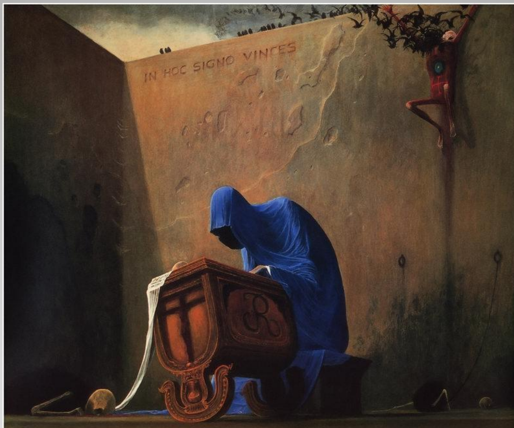
Zdzislaw Bekinski The Fantastic Art Of

IN HOC SIGNO VINCES – POD TYM ZNAKIEM ZWYCIĘŻYSZ