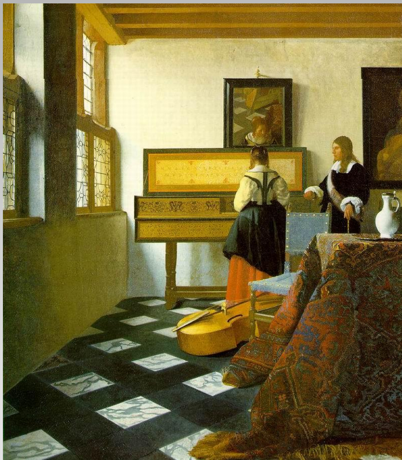
J. Vermeer van Delft, Lekcja muzyki (Dama przy wirginalie w towarzystwie mężczyzny) , ok. 1664, olej na płótnie, 73, 6 x 64, 1 cm, Buckingham Palace, Londyn