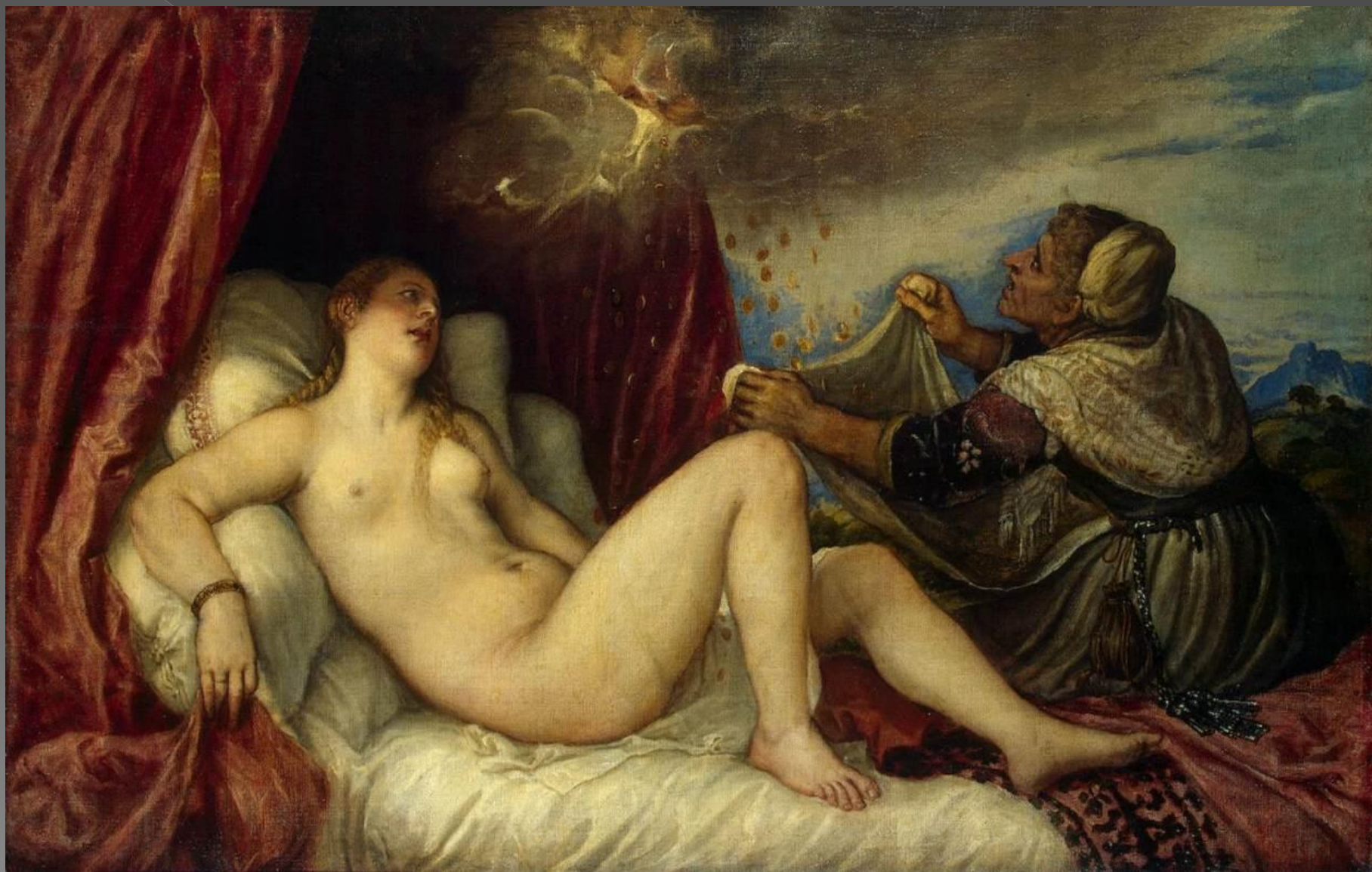
Tycjan, Danae , ok. 1554, olej na płótnie, 129 x 180 cm, Prado, Madryt